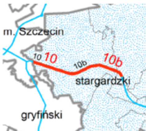
Rysunek 1. Lokalizacja analizowanych odcinków DK10 w gminie Kobylanka.

Wg raportów, WIOŚ w latach 2013 i 2012 na obszarze gminy Kobylanka nie prowadził pomiarów natężenia hałasu. Również aktualna „Mapa akustyczna dla dróg wojewódzkich o ruchu powyżej 3.000.000 pojazdów rocznie położonych na terenie Województwa Zachodniopomorskiego” nie zawiera analiz odnoszących się do terenów w gminie Kobylanka. Pomiary hałasu drogowego, na dwóch odcinkach DK10 przebiegającej przez gminę, prowadzono przed zmianą dopuszczalnych poziomów hałasu, w ramach opracowania map akustycznych dla dróg krajowych i ruchu powyżej 3 000 000 pojazdów przez GDDKiA.